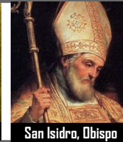
San Isidro, Obispo