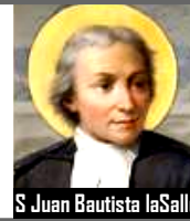
S Juan Bautista laSalle