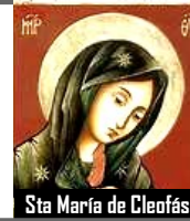
Sta Maria de Cleofás