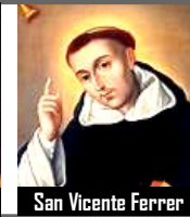
San Vicente Ferrer