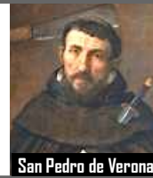
San Pedro de Verona