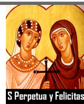
S Perpetua y Felicitas