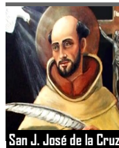
San J. José de la Cruz