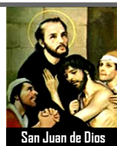
San Juan de Dios