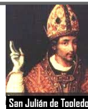
San Julián de Toledo