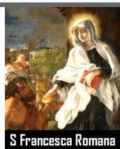
S Francesca Romana